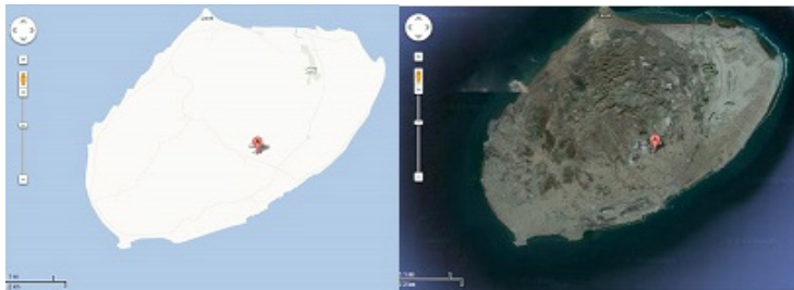
شکل ۳- جزیره ی لارک ( http://maps.google.com )