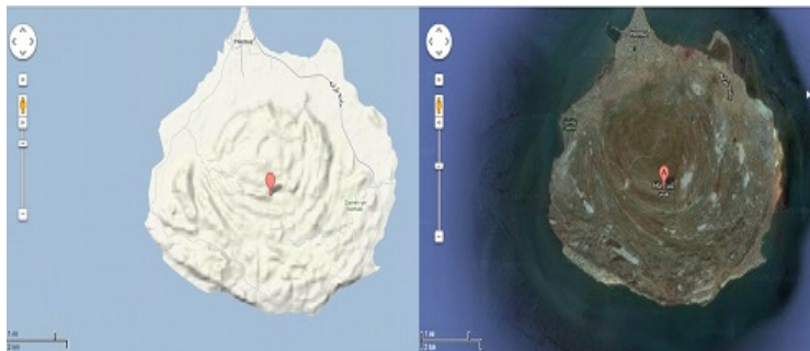
شکل ۱- جزیره هرمز ( http://maps.google.com )

هرمز، جزیره‌ای است بیضی شکل که نوعی گنبد نمکی است به مساحت ۴۲ کیلومتر مربع برابر با ۱۶ مایل مربع که در ورودی خلیج فارس و در ۸ کیلومتری بندرعباس قرار دارد. این جزیره را به علت موقعیت جغرافیایی آن و مجاورت با تنگه‌ی هرمز، کلید خلیج فارس می‌دانند. همین موقعیت است که آن را در طول تاریخ، از نظر راهبردی و بازرگانی مهم کرده است (wikipedia).