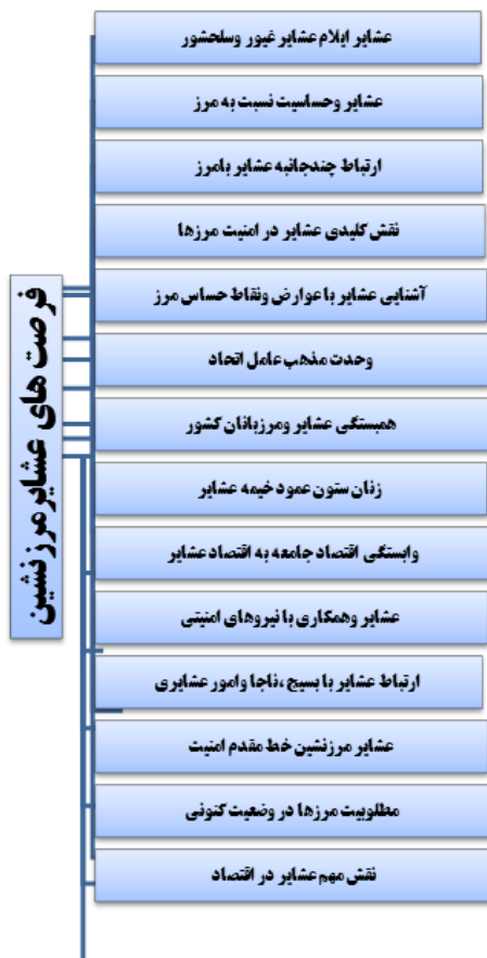
نمودار ۲. فرصت‌های عشایر مرزنشین

در نمودار شماره ۳ راهکارهایی که توسط مصاحبه‌شوندگان با توجه به چالش‌ها و فرصت‌های احصاشده عنوان نمودند، مشاهده می‌شود.