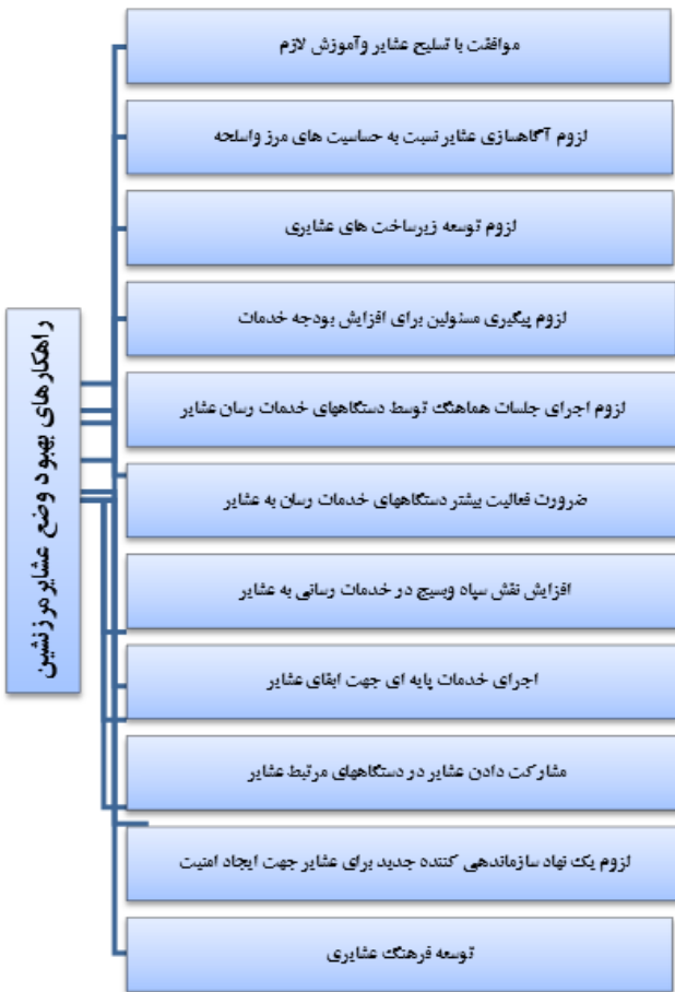
نمودار ۳. راهکارهای بهبود وضعیت عشایر مرزنشین

در نمودار شماره ۴ مصاحبه‌شوندگان دستگاه‌های مرتبطی را که می‌توانند تأثیر مستقیم بر عشایر داشته باشند، معرفی نمودند. یکی از سؤالات موردپرسش از مصاحبه‌شوندگان به این صورت بود که چه نهادها و دستگاه‌های دولتی و غیردولتی با عشایر مرزنشین ارتباط داشته و وظیفه خدمات‌رسانی به این قشر را برعهده دارند؟ که در پاسخ، اکثریت آنها نهادهایی از جمله اداره امور عشایری، اداره منابع طبیعی، سازمان بسیج عشایری، ناجا، جهاد کشاورزی و... را معرفی می‌کردند.