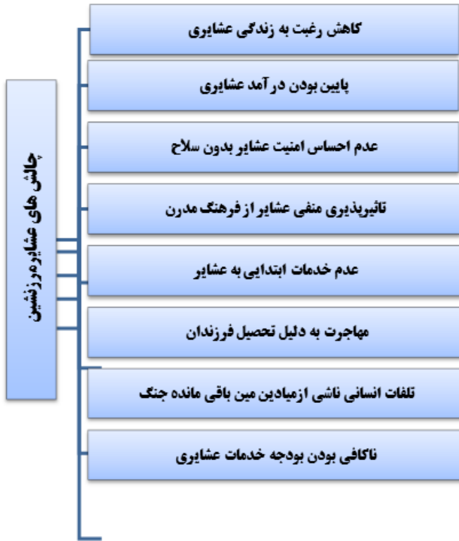
نمودار ۱. چالش‌های عشایر مرزنشین